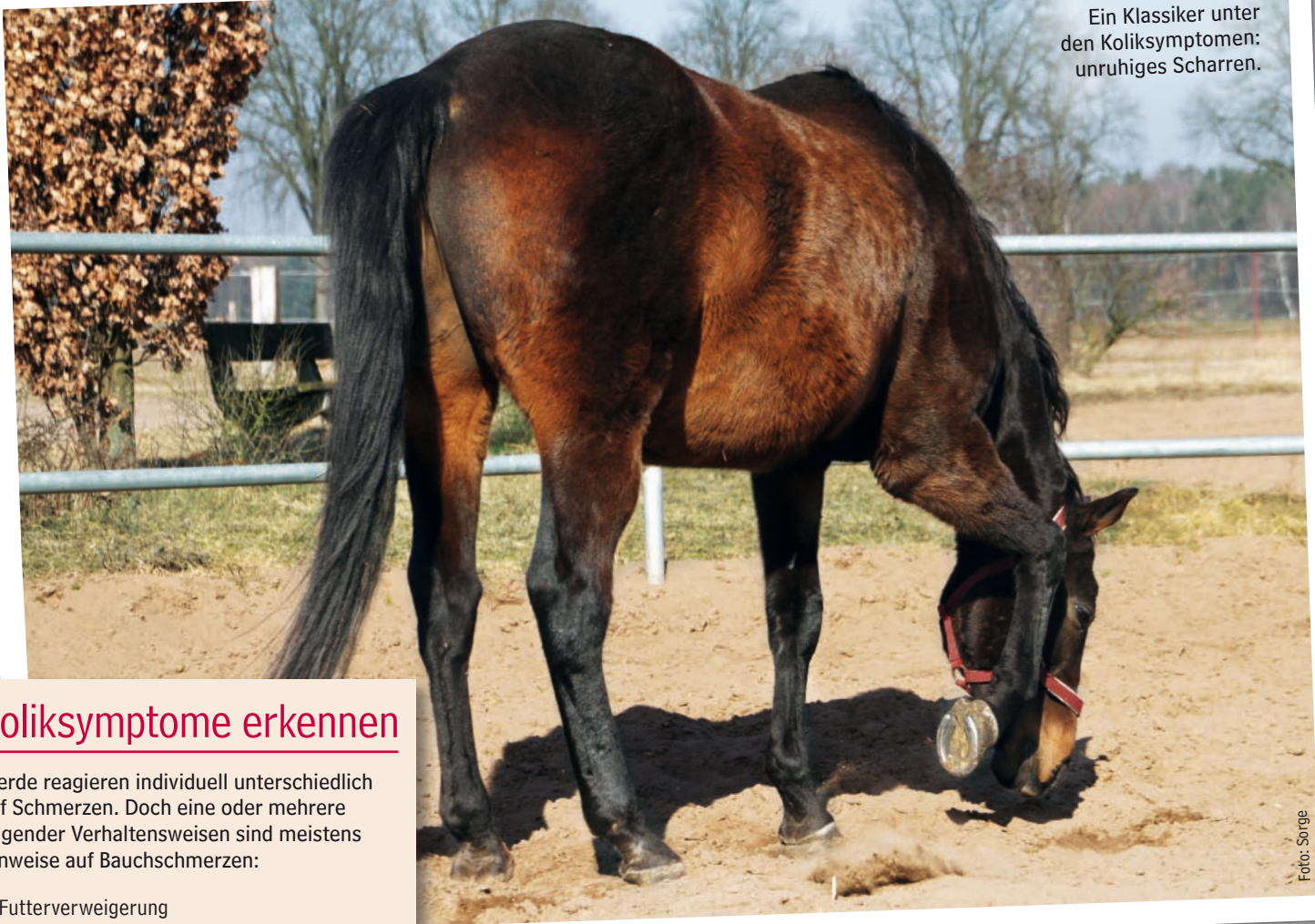
Ein Klassiker unter den Koliksymptomen: unruhiges Scharren.