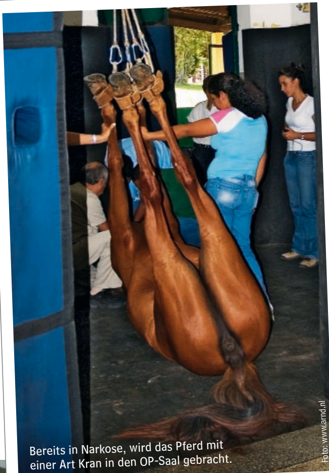
Bereits in Narkose, wird das Pferd mit einer Art Kran in den OP-Saal gebracht.