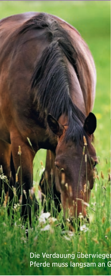
Die Verdauung überwiegend im Stall gehaltener Pferde muss langsam an Gras gewöhnt werden.